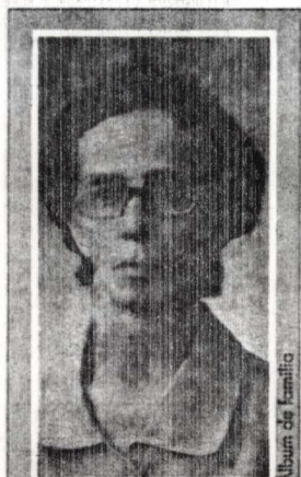
Album de família