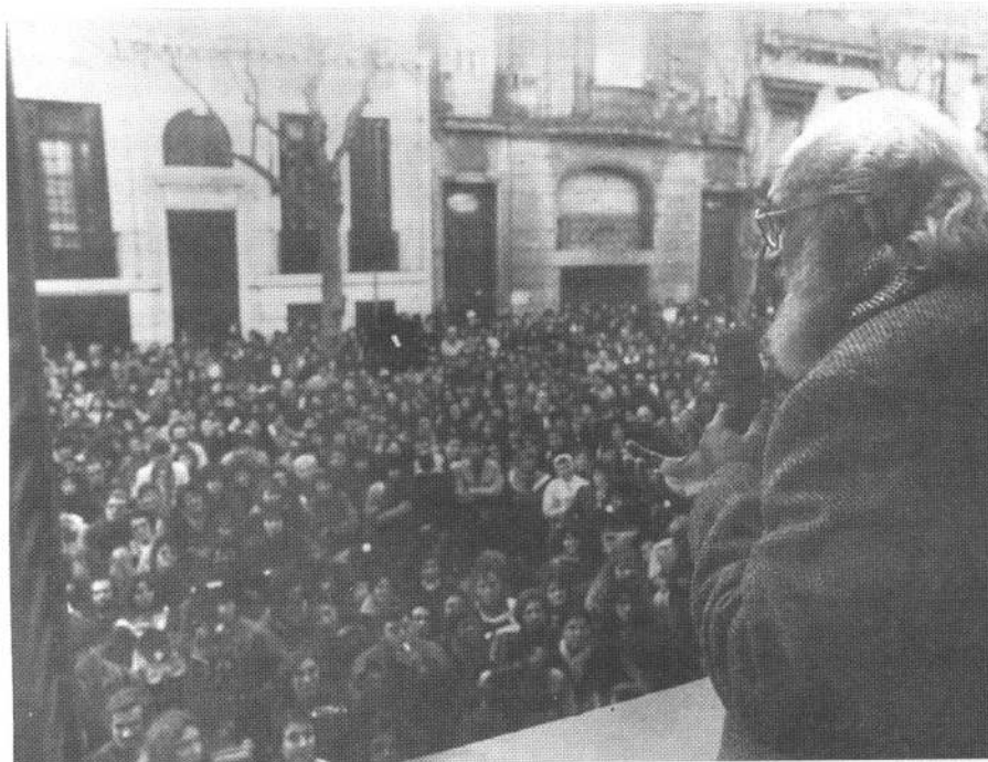
"La educación debe enfatizar la capacidad crítica en los seres humanos".

Paulo Freire, ahora con Nita y antes con Elza, logró realizarse en el goce, en la plenitud de darse, en la creación permanente de nuevas formas de dar, recibir, y hacer el amor. Sin hablar de política y pedagogía habíamos compartido y aprendido algo fundamental: que no es la razón sino la emoción y el amor los que hacen posible la relación de convivencia y de aceptación mutua.