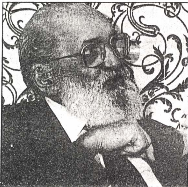
Paulo Freire, autor de "Pedagogía del oprimido", habla sobre los planes de alfabetización en América Latina y el Tercer Mundo.

Yo he recibido algunos premios internacionales y sé lo que significó para mí como estímulo, como empuje e incluso como una advertencia de que si no sigo trabajando seriamente, puedo ser "despremiado". La importancia de los premios es muy grande y se debería difundir más la existencia de los mismos, hay que estimular organismos más que individuos, plantear y mostrar su trabajo. Sobre todo ahora que la UNESCO proyecta para 1990, probablemente un Año Internacional de la Alfabetización.