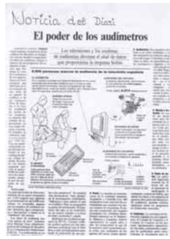
Reproducció de l'últim DIUEN núm. 8 Any VII 12-5-06

El segon grup sempre és el de manteniment. Amb aquesta paraula recollim les feines que cal fer a classe de forma diària: apagar els llums per a no malbaratar l'energia elèctrica o tancar les finestres per aprofitar la calorífica; esborrar la pissarra cada vegada que s'acaba la classe; posar la data del dia; i avisar als companys i companyes que pugen les cadires per facilitar la feina al personal de neteja. El tercer grup s'anomena de decoració i com indica la paraula, la seva funció és intentar que la classe estiga ordenada. El seu treball es reparteix en tindre cura del tauler de suro que hi tenim per a que tot estiga recte i ben posat, que els cartells i murals de les parets