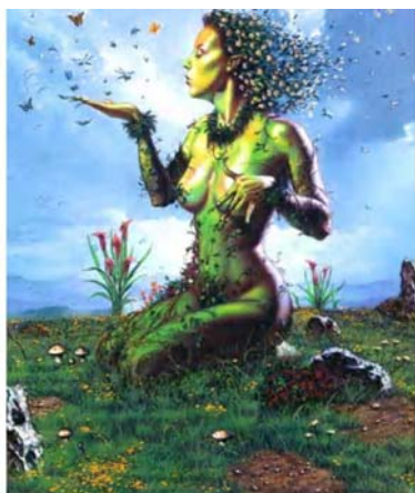
Figura 3: foruns.terravista.gaia.pt/

Com a esperança voltada à ação, seguia o caminho, incerto sim, mas que a cada passo se me revelava um pouco de mim e das aspirações do outro, e assim continuava colocando em prática as