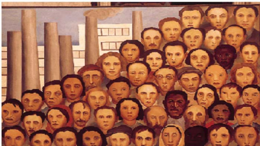
Figura 13: http://www.nomismatike.hpg.ig.com.br/Brasil/PPopul3.gif

Governo de Eurico Gaspar Dutra (1946-1951), começa com a convocação da Constituinte e a promulgação da Carta de 1946, democrática e liberal. Mas a intensificação da Guerra Fria no contexto internacional e as pressões norte-americanas diretas levaram o governo a promover recuos dos direitos constitucionais