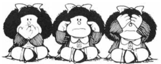
Figura 20: A Educação durante a Ditadura Militar

Após o golpe, a principal medida tomada foi a repressão a tudo e a todos considerados suspeitos de práticas, ou mesmo de idéias, subversivas. A mera acusação de que uma pessoa, um livro ou programa educativo tivesse inspiração comunista, já era motivo para demissão, suspensão ou até prisão.