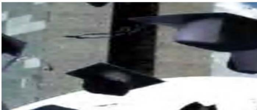
Figura 21: http://www.mec.gov.br/reforma/imagem/noticias.jpg

Diversas medidas foram tomadas para alcançar tais metas, entre elas: a unificação do vestibular por região; o ingresso por classificação; o estabelecimento de limite no número de vagas por curso; a criação do curso básico que reunia disciplinas afins em um mesmo departamento; o oferecimento de cursos em um mesmo espaço, com menor gasto de material, e sem aumentar o número de professores; a fragmentação e dispersão da graduação; o estabelecimento de matrícula por disciplina. Em 1971, foi promulgada a Lei 5692 que instituiu também a reforma do ensino fundamental, com mudanças que determinaram, por exemplo, a extinção das disciplinas de Geografia e História que foram substituídas pelo ensino de Estudos Sociais.