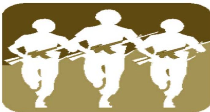
Figura 11: http://www.portalmilitar.net/Logos/exercito.gif

uma reivindicava seus espaços políticos. Os tenentes conseguiram ser nomeados interventores em alguns Estados. O governo chefiado por Vargas tentava caminhar junto com suas bases de apoio, ao mesmo tempo em que prosseguia com seu programa de centralização política.[...]