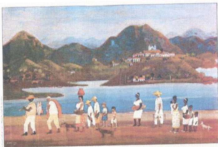
Na Praia (50x70 cm). Flávio Pennacchi (1905- )